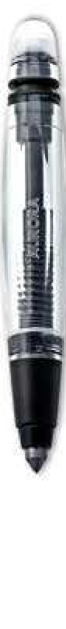
Cappuccio e corpo in resina trasparente. Finiture nere satinare. Cap and barrel in transparent resin. Black satin trims.

Stilografica con pennino in oro massiccio 18Kt. / Fountain pen with 18Kt. solid gold nib.