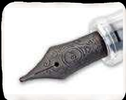
Originale pennino 18Kt. nero. 18Kt. black gold nib.