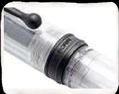
Incisione del logo Aurora. Engraving of the Aurora logo.