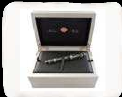
Elegante astuccio in legno laccato argento. Elegant case in silver lacquered wood.